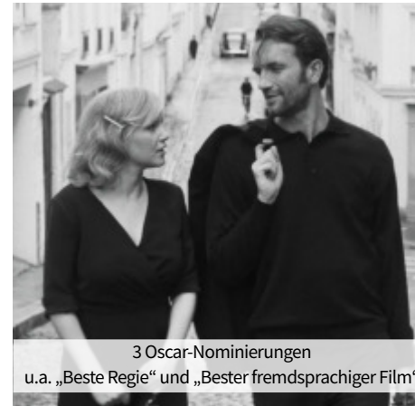
3 Oscar-Nominierungen u.a. „Beste Regie“ und „Bester fremdsprachiger Film“

"We will rock you" - Die Rockband Queen hat mit ihren Shows und ihrer Musik neue Maßstäbe gesetzt. Ihr Frontmann Freddie Mercury war ein begnadeter Sänger, Entertainer und eine Ikone der Schwulenzbewegung. Der Film zeigt die Geschichte der Band, mitsamt dem Höhepunkt "Live Aid 1985", einem der größten Auftritte in der Geschichte der Rock-Musik. Nur sechs weitere glorreiche Jahre verblieben der Band, bis Freddie Mercury 1991 an AIDS starb.