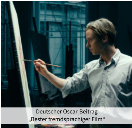
Deutscher Oscar-Beitrag „Bester fremdsprachiger Film“