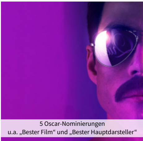
5 Oscar-Nominierungen u.a. „Bester Film“ und „Bester Hauptdarsteller“

Wie konnte es nur zu Donald Trump kommen? Der Filmemacher versucht herauszufinden, wie die Vereinigten Staaten von Amerika in politischen Dingen so absteigen konnte. Er reist durch ein Land in der Krise. So wird in Flint, Michigan Wasser vergiftet. In Parkland findet 2018 ein High School-Massaker statt. Teil für Teil setzt sich ein Puzzle zusammen, das eine Gesellschaft zeigt, die immer mehr von Gewalt bestimmt ist - und auf Gewalt vertraut.