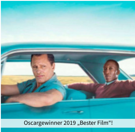
Oscargewinner 2019 „Bester Film“!