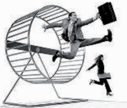
Dokumentarfilm des Monats