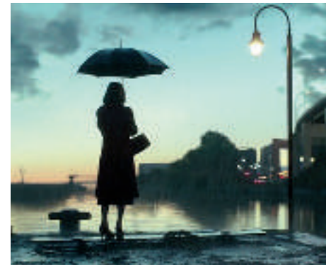
Oscars „Bester Film“ & „Beste Regie“

Nach Monaten konnte der Mörder von Mildred Hayes' Tochter noch nicht aufgespürt werden. Die verzweifelte Mutter bemalt drei große Plakate vor ihrer verschlafenen Heimatstadt mit provokanten Sprüchen. So will sie die Unfähigkeit des sonst so gefeierten Polizeichefs Willoughby anprangern. Damit aber gerät sie in einen Kleinkrieg mit dem aufbrausenden Officer Dixon. Doch Mildred Hayes lässt nicht locker. Sie will Gerechtigkeit, um jeden Preis.