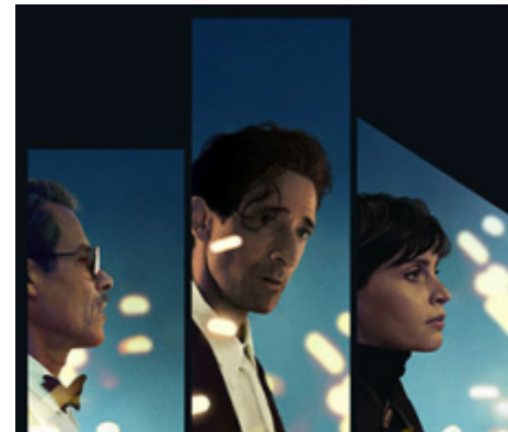
Inklusive 15-minütiger Pause!

D: Angelina Jolie, Alba Rohrwacher, Pierfrancesco Favino R: Pablo Larrain | FSK 6 | 123 min | USA 2024