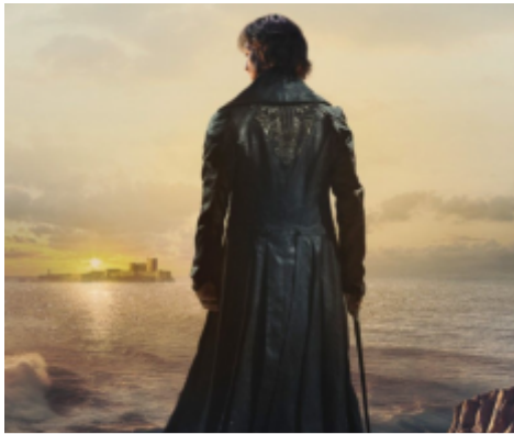
Am Mittwoch, 26. März um 20:30 Uhr in der französ. Originalfassung mit dt. Untertiteln