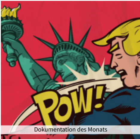
Dokumentation des Monats

Eine lange Autofahrt führt zwei sehr unterschiedliche Männer quer durch die USA: 1962 soll der ungebildete Tony Lip den berühmten klassischen Pianisten Dr. Don Shirley aus New York in die Südstaaten fahren. Shirley ist kultiviert, wohlhabend - und schwarz. Tony Lip eckt ständig bei ihm an mit seiner grob-schlächtigen Art. Doch als er seinen Boss aus einer brenzigen Situation hilft, merken beide, dass sie noch viel voneinander lernen können.