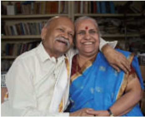
Dokumentarfilm des Monats