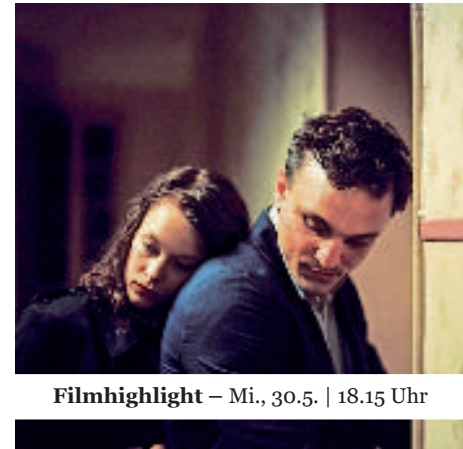
Filmhighlight – Mi., 30.5. | 18.15 Uhr