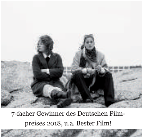
7-facher Gewinner des Deutschen Filmpreises 2018, u.a. Bester Film!