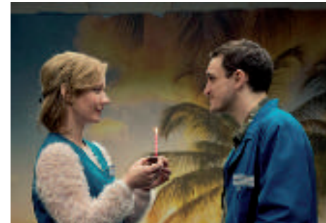
Frühstückskino – Do., 21.6. | 10.00 Uhr inkl. belegten Brötchen und Kaffee Anmeldung erwünscht

Marlo reibt sich für ihre drei Kinder auf. Besonders das Neugeborene lässt sie nachts kaum schlafen. Da überrascht ihr Bruder sie mit einer „Night Nanny“, einem Kindermädchen für die Nacht. Sie heißt Tully und ist Studentin. Marlo ist das Geschenk ihres Bruders zunächst suspekt, aber sie lässt sich darauf ein. Schon bald schließt die überforderte Mutter die junge Frau in ihr Herz. Mit der Zeit entsteht zwischen den beiden eine enge Bindung.