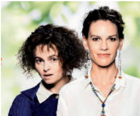
Filmhighlight – Mi., 27.6. | 18.15 Uhr

Maria Callas war eine der großen Opernsängerinnen des 20. Jahrhunderts. Ihre Persönlichkeit indes war zerrissen: Sie fühlte sich zeitlebens unverstanden. Die Dokumentation geht anlässlich ihres 40. Todestages der Person Maria Callas auf den Grund. Anhand von unveröffentlichtem Material sollen neue Facetten in Leben und Wirken der Sopranistin sichtbar werden. Ihre Affäre mit dem Milliardär Onassis, ihre Rollen - all dies erscheint in neuem Licht.