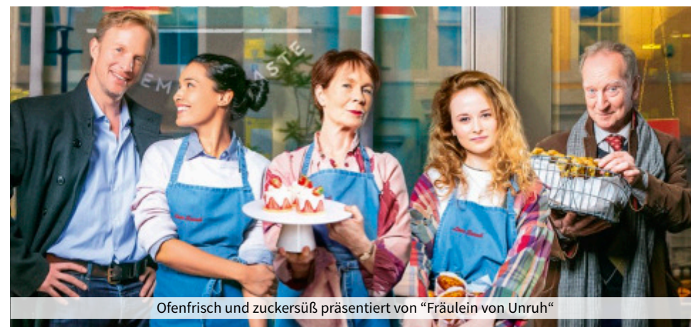
Ofenfrisch und zuckersüß präsentiert von "Fräulein von Unruh"