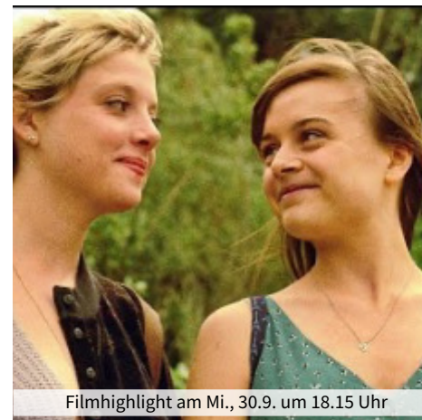
Filmhighlight am Mi., 30.9. um 18.15 Uhr